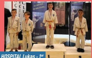
HOSPITAL Lukas - 1 er